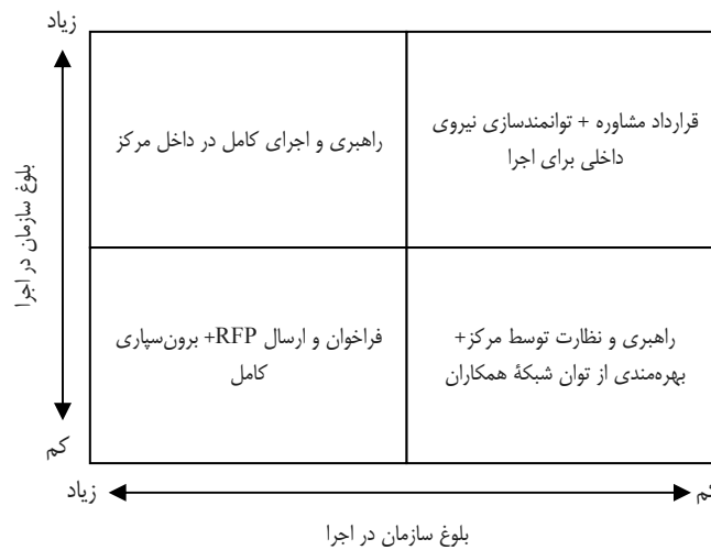
شکل ۲. طبقه‌بندی نحوه مدیریت اجرای برنامه‌ها بر مبنای منطق TRL

که قابلیت اقتصادی در محیط سازمان و بلوغ سازمان (منابع انسانی، فیزیکی و مالی) در اجراها را بر مبنای دو معیار، در چهار گروه مطابق شکل ۲ دسته‌بندی می‌کند.