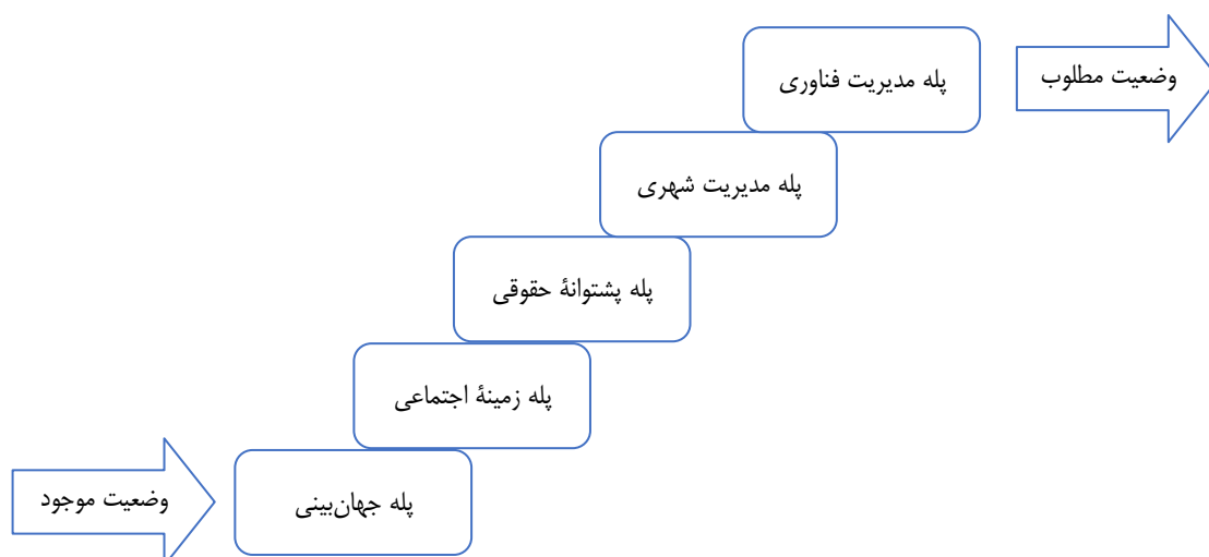
شکل ۳. چارچوب پلکان خطمشی‌گذاری هوش مصنوعی

به‌منظور سامان دادن نتایج استخراج شده در این پژوهش، ما استعاره پلکان را برای جمع‌بندی انتخاب کرده‌ایم. استفاده از استعاره جهت ساده‌سازی مفاهیم پیچیده و چندگانه این پژوهش، و ایجاد توان توصیفی، ایجاد قابلیت استفاده به‌عنوان ابزار تحلیل، ایجاد قابلیت تعیین مطلوبیت رویکردهای هنجاری فعلی، و تمرکز و روایت‌گری ویژه زمینه خاص پژوهش، یعنی مدیریت شهری و استفاده از هوش مصنوعی در آن است. ما دو هدف عمده از انتخاب استعاره پلکان برای بیان نتیجه این پژوهش داشته‌ایم، ابتدا اینکه این پلکان ما را از نقطه اول یعنی وضعیت موجود (فاقد دید روشن نسبت به خطمشی هوش مصنوعی در شهر) به نقطه دوم یعنی وضعیت مطلوب (دارای تصویر و دید روشن نسبت به ابعاد خطمشی هوش مصنوعی در شهر) می‌رساند. نکته دوم وجود ترتیب در میان پله‌های پلکان است. در واقع یکی از دستاوردهای این پژوهش رسیدن به ترتیبی از اولویت‌ها در تصمیم‌گیری در ارتباط با خطمشی‌های هوش مصنوعی در شهر با ترکیب بایسته‌های ذکر شده در پژوهش‌های پیشین است. رسیدن از یک وضعیت نامناسب در خطمشی‌گذاری هوش مصنوعی در شهرها به یک شرایط قابل قبول نیازمند آن است که این ترتیب در تصمیم‌گیری و اندیشه مورد توجه قرار گیرد. مطابق با تصویر زیر پلکان شامل پله جهان‌بینی، پله تحلیل جامعه، پله پشتوانه حقوقی، پله مدیریت شهری و در نهایت پله مدیریت فناوری است.