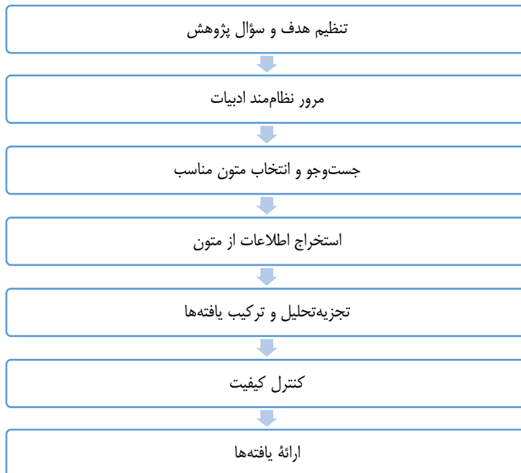
شکل ۱. مراحل انجام فراترکیب

روش‌شناسی سندلوسکی و بارسو ۳ (۲۰۰۷) به صورت عام در میان پژوهش‌های صورت پذیرفته در حوزه مدیریت در بخش عمومی مورد قبول گرفته است و محققان به صورت متواتر با ارجاع به آن پژوهش فراترکیب خود را انجام داده‌اند و مورد پذیرش محافل علمی و مجلات دانشگاهی نیز قرار گرفته است. لذا در این مقاله ما نیز از گام‌های مطرح شده در این روش‌شناسی به شرح زیر پیروی می‌کنیم.