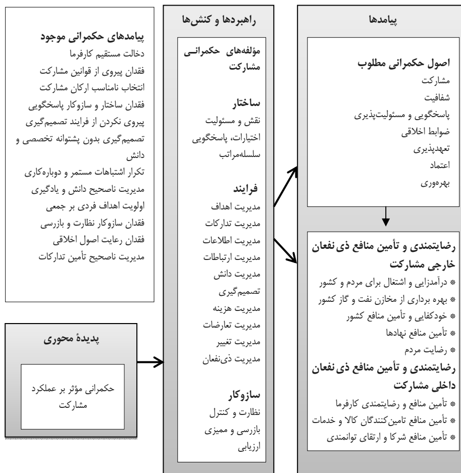
شکل ۳. مدل نظری حکمرانی مؤثر بر عملکرد