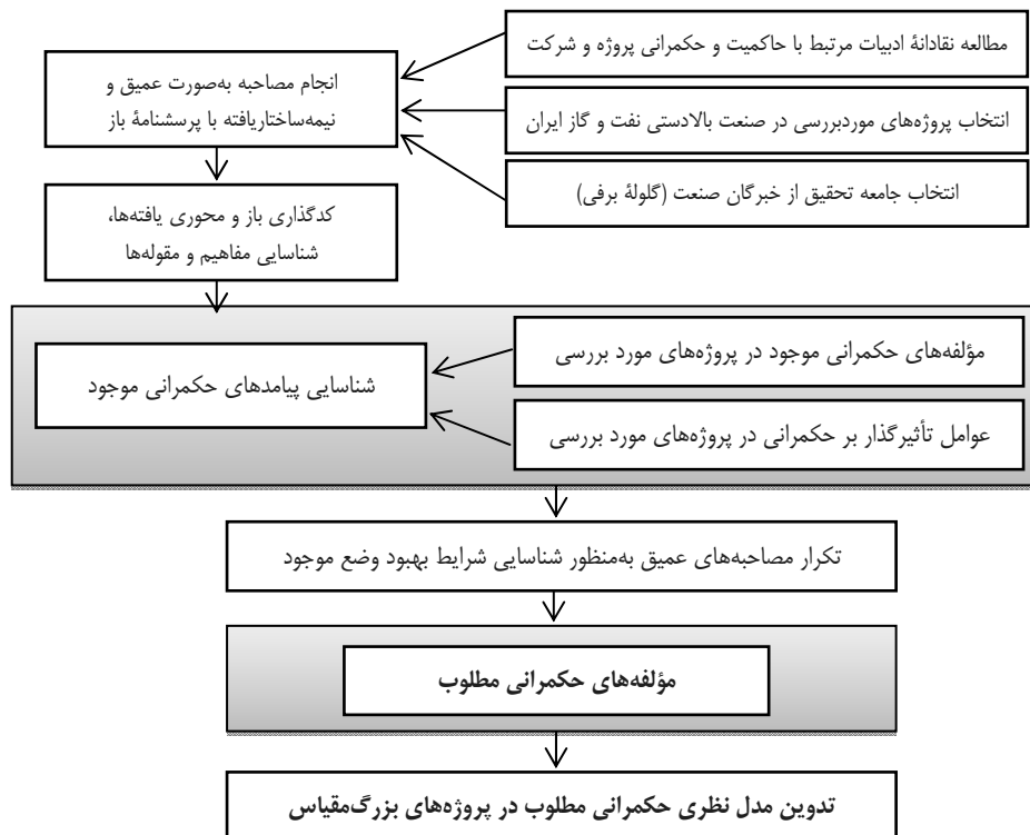
شکل ۱. مراحل اجرای پژوهش

افراد در شرکت‌های عضو مشارکت (پیمانکار و کارفرما) در زمینه‌های مدیریت طرح، مجری طرح، مدیر برنامه‌ریزی، مدیر مشارکت، مدیر کمیته راهبردی و مدیریت پروژه، نقش کلیدی داشتند. محدوده سنی این افراد بین ۴۸ تا ۶۹ سال و تجربه کاری آنها بیش از ۱۵ سال بود. واحد تحلیل پژوهش مشارکت‌های بالا در نظر گرفته شده است. برای بهره‌مندی بهتر از زمان جلسه و همچنین ثبت دقیق مکالمات، با کسب اجازه از مصاحبه‌شونده علاوه بر یادداشت‌برداری از موارد مهم، فایل صوتی مصاحبه‌ها ضبط شد و در تجزیه و تحلیل داده‌ها در کدگذاری باز به کار رفت. فرایند انجام مصاحبه و انتخاب دست‌اندرکاران آگاه پروژه در جامعه پژوهش تا مرحله اشباع نظری و تکرار داده‌ها در مصاحبه‌ها ادامه یافت. در مواردی به دلیل کافی نبودن زمان، مصاحبه‌ها طی دو یا سه جلسه انجام گرفت. شایان ذکر است، به منظور مشارکت فعال مصاحبه‌شوندگان و نبود زمان کافی، فایل صوتی جلسه تهیه شده و سپس پرسشنامه توسط مصاحبه‌گر پر شده است. بدین منظور گام‌های فرایند اجرای پژوهش حاضر به صورت شکل ۱ ترسیم شده است.