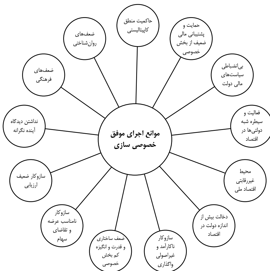
شکل ۳. شبکه مضامین به‌دست آمده از تحقیق

مرحله ششم زمانی آغاز می‌شود که محقق مجموعه‌ای از مضمون‌های اصلی کاملاً انتزاعی و منطبق بر ساختارهای زمینه‌ای تحقیق را در اختیار داشته باشد. این مرحله شامل تحلیل پایانی و نگارش گزارش است که در ادامه ارائه شده است. در شکل ۳ شبکه مضامین به‌دست آمده مشاهده می‌شود.