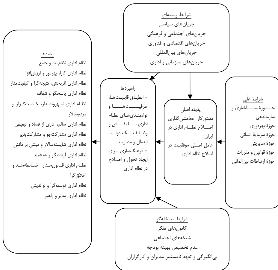
شکل ۲. مدل داده‌بنیاد دستور کار خط‌مشی‌گذاری اصلاح نظام اداری در ایران

اثربخش، نتیجه‌گرا و کیفیت‌مدار، پاسخگو و شفاف، شهروندمدار، خدمتگزار و مردم‌سالار، سالم، عاری از فساد و تبعیض، اداری مشارکت‌جو و مشارکت‌پذیر، شایسته‌سالار و مبتنی بر دانش، آینده‌نگر و هدفمند، قانون‌مدار، ضابطه‌مند و اخلاق‌گرا، توسعه‌گرا، نواندیش، مدیر و راهبر را در پی خواهند داشت.