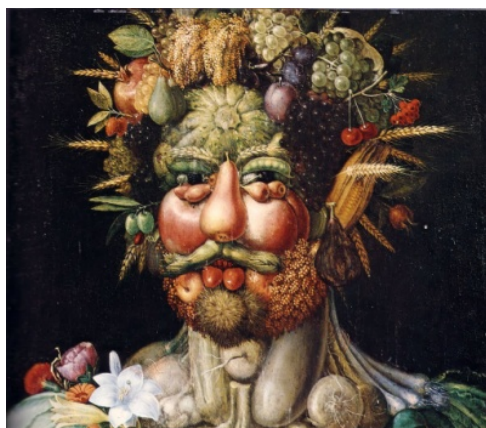
شکل ۱. مفهوم سازمان و ساختار به‌صورت شماتیک

آن مد نظر باشد این کلمات درون گیومه قرار می‌گیرند و در غیر این صورت مفاهیمی هستند که در این نظریه مطرح شده‌اند. سازمان یک سیستم به روابط بین مؤلفه‌های آن سیستم اشاره دارد و سیستم را به‌عنوان واحدی مرکب در یک طبقه خاص تعریف می‌کند و ویژگی‌های سیستم را به‌عنوان یک کل معین می‌کند. ساختار به مؤلفه‌های واقعی و روابط واقعی اشاره دارد که یک سیستم یا واحد مرکب را به‌عنوان موردی خاص از یک طبقه مشخص به وجود می‌آورد. باید توجه داشت که ساختار، ویژگی‌های سیستم به‌عنوان یک کل را تعیین نمی‌کند و از آنجا که سازمان جنبه روابط تحقق‌یافته در ساختار است، نمی‌تواند مستقل از ساختاری که آن را محقق کرده است، وجود داشته باشد (ماتورانا، ۲۰۰۲). یک سیستم، سازمان خود (هویت خود) را حفظ می‌کند در حالی که ساختار آن دائم در حال تغییر است. البته باید توجه داشت که تغییرات ساختار در چارچوب حفظ هویت سیستم یعنی سازمان آن انجام می‌گیرد. حفظ سازمان سیستم، شرط وجود آن سیستم است و اگر سازمان یک سیستم تغییر کند آن سیستم از هم می‌پاشد و چیزهای متفاوت دیگری به وجود می‌آید (وارلا، ماتورانو و یوریب، ۱۹۷۴).