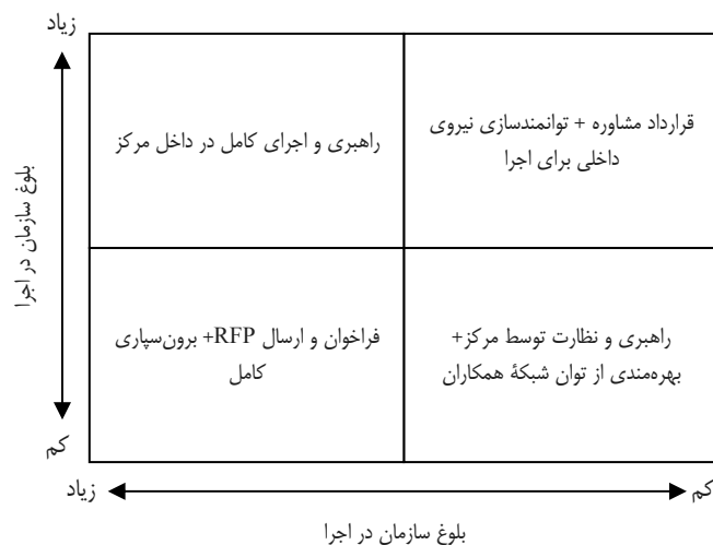
شکل ۲. طبقه‌بندی نحوه مدیریت اجرای برنامه‌ها بر مبنای منطق TRL

که قابلیت اقتصادی در محیط سازمان و بلوغ سازمان (منابع انسانی، فیزیکی و مالی) در اجراها را بر مبنای دو معیار، در چهار گروه مطابق شکل ۲ دسته‌بندی می‌کند.