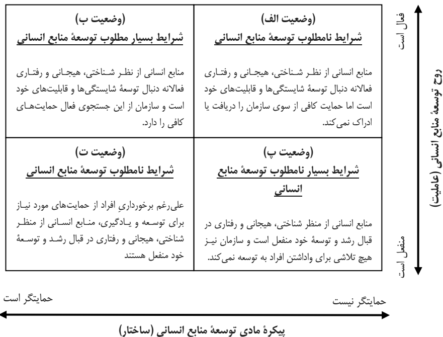
شکل ۱. ماتریس توسعه منابع انسانی: نقش دوسویه عاملیت و ساختار در توسعه منابع انسانی

فهم دوسویگی عاملیت و ساختار در توسعه منابع انسانی در قاموس نظریه ساختاری گیدنز، با در نظر گرفتن این دو عامل به‌عنوان دو نقطه مرجع استراتژیک، به ایجاد ماتریسی با چهار وضعیت مشخص منجر می‌شوند که آن را در این پژوهش «ماتریس توسعه منابع انسانی» می‌نامیم (شکل ۱). ماتریس توسعه منابع انسانی، در واقع نوعی الگوی تعاملی با استفاده از دو مرجع استراتژیک عاملیت و ساختار است، بنابراین، نوعی گونه‌شناسی محسوب می‌شود. گونه‌شناسی‌ها از انواع نظریه‌های توصیفی محسوب می‌شوند. بنیان نظریه‌های دیگر، بر نظریه‌های توصیفی استوار است و هنگامی مفید هستند که دانش اندکی درباره پدیده مورد مطالعه وجود دارد (دانایی فرد، ۲۰۱۰: ۱۴۸). با توجه به آنکه در مدل مفهومی ارائه شده، نقاط مرجع استراتژیک با اتکا به اصول نظریه‌های اقتضایی، در نظر گرفته شده است، می‌توان مدعی شد که ماتریس توسعه منابع انسانی، صرفاً توصیفی نبوده و از قدرت تبیین‌کنندگی و پیش‌بینی موفقیت یا شکست استراتژی‌های توسعه منابع انسانی در سازمان نیز برخوردار است. بنابراین مدل تعاملی ارائه‌شده در موضع فهم و توصیف خصیصه‌های توسعه منابع انسانی در سازمان از