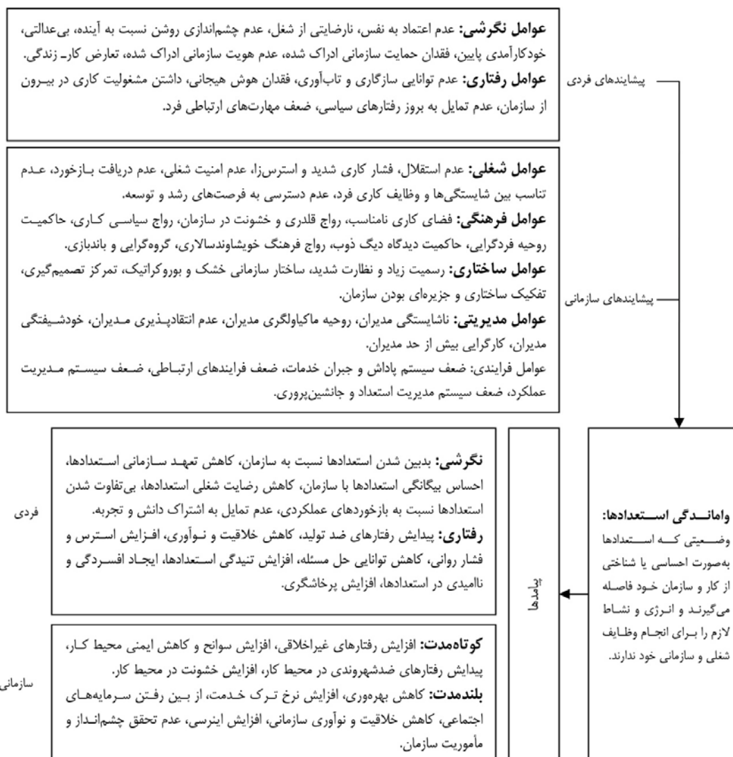
شکل ۳. الگوی واماندگی استعدادهای

در مرحله ششم، جهت ارزیابی اعتبار تحلیل‌های انجام شده، از شاخص کاپا استفاده شد. در این ارتباط، فرد دانش‌آموخته دکتری مدیریت منابع انسانی (بدون آگاهی از نحوه کدگذاری و مفهوم‌های ایجاد شده توسط پژوهشگران)، به گروه‌بندی مقوله‌های استخراج شده اقدام کرد. پس از آن، گروه‌های ارائه شده توسط پژوهشگران با گروه‌های ارائه شده توسط فرد خبره، مقایسه شدند. محاسبات انجام شده نشان می‌دهد که مقدار شاخص کاپا برای پیشایندها و پیامدهای غیبت ذهنی کارکنان بالاتر از ۰/۷ است که مطابق با استاندارد شاخص کاپا (گویت ۱ ، ۲۰۱۴)، تحلیل‌های انجام شده در سطح اعتبار معتبر قرار می‌گیرند. در مرحله هفتم فراترکیب نیز به طراحی الگوی پیشنهادی در قالب شکل ۳ و ارائه نتایج در قالب این مطالعه اقدام شد.