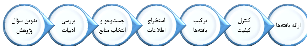
شکل ۱. مراحل فراترکیب

پژوهش حاضر، مطالعه‌ای کیفی است که با استفاده از فراترکیب انجام شده است. در این ارتباط، رویکرد هفت مرحله‌ای سندلوسکی و باروسو ۱ (۲۰۰۷) به‌منظور طراحی الگوی پیشایندها و پیامدهای واماندگی استعدادها (شکل ۱) استفاده شده است. جامعه آماری را مطالعات پیشین تشکیل می‌دهند. در این میان، پس از جست‌وجو و یافتن منابع موجود، از طریق بررسی و ارزیابی عنوان، چکیده و محتوای منابع یافت شده، به انتخاب منابع مناسب برای انجام پژوهش به‌عنوان نمونه، اقدام شده است. داده‌های لازم نیز از طریق بررسی یافته‌های منابع منتخب گردآوری و با روش تحلیل مضمون ۲ تحلیل شده‌اند. تحلیل مضمون، روشی برای تحلیل داده‌های پراکنده و متنوع و تبدیل آن‌ها به داده‌هایی غنی و تفصیلی در راستای پاسخ به سؤال پژوهش یا گفت‌وگو پیرامون یک مسئله است (مگوایر و دلاهورنت ۳ ، ۲۰۱۷).