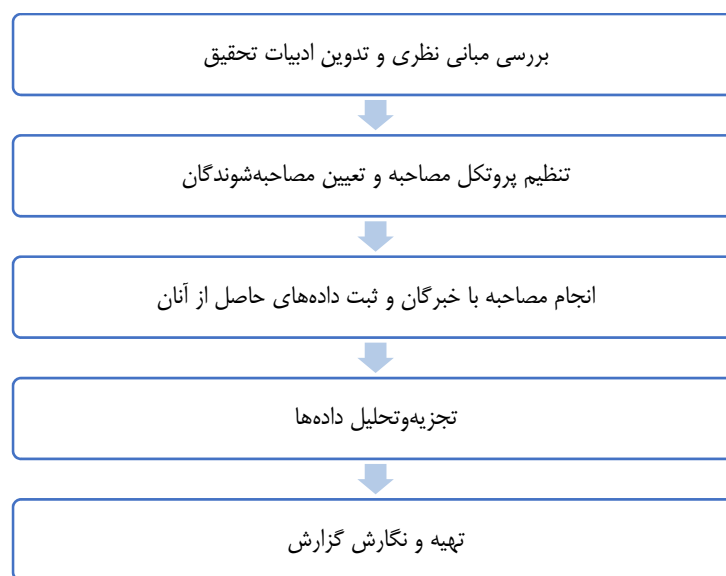
شکل ۲. فرایند اجرایی پژوهش

و کلارک ۱ ، ۲۰۰۶). تحلیل مضمون از نوع استقرایی است؛ چون بر اساس داده‌های حاصل از مصاحبه‌ها و مبتنی بر آن‌ها صورت گرفته است. گفتنی است که پژوهش حاضر در صدد ارائه راه‌حلی برای برطرف‌سازی موانع و چالش‌های موجود بر سر راه مدیریت منابع انسانی در سازمان‌ها بوده است؛ چون آگاهی از نحوه به‌کارگیری فناوری‌های تحول‌آفرینی، همچون اینترنت اشیا، در واحدهای سازمانی از جمله منابع انسانی، آنان را برای حضور و فعالیت در عصر دیجیتال آماده خواهد ساخت. بدین جهت، پژوهش حاضر در زمره پژوهش‌های کاربردی جای می‌گیرد. به‌طور کلی، فرایند اجرایی پژوهش و مراحل انجام آن در شکل ۲ نمایش داده شده است.