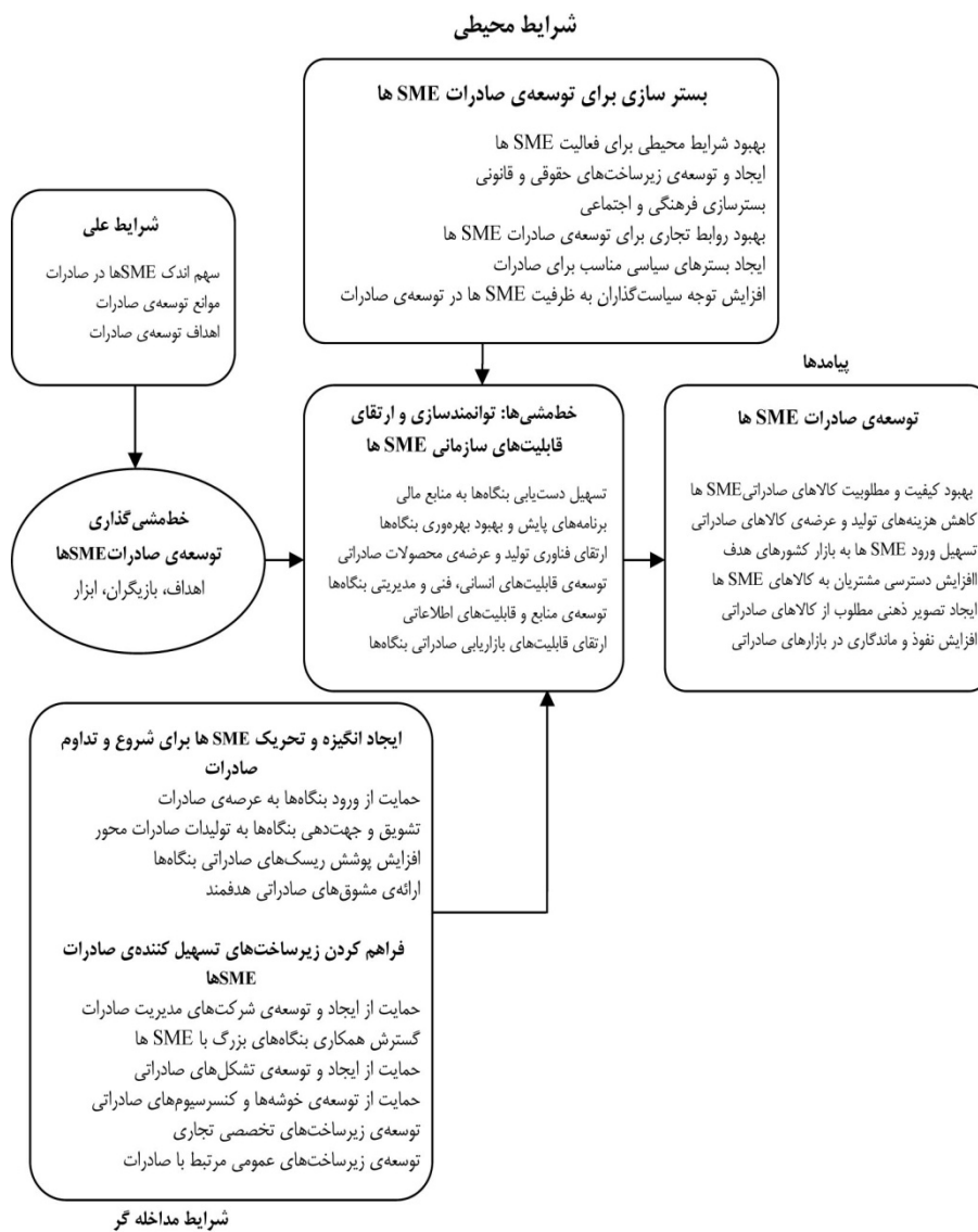
نمودار ۲. الگوی پارادایمی خط‌مشی‌گذاری توسعه‌ی صادرات SMEها

برای تبیین خط‌مشی‌گذاری توسعه‌ی صادرات بنگاه‌های کوچک و متوسط، نمودار شماره ۲ ارائه شده است.